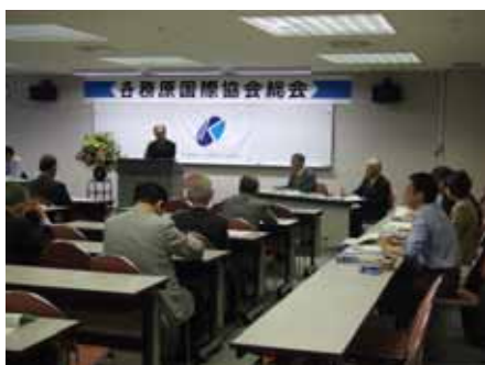
< 総会の様子 >