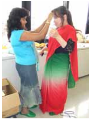
伝統衣装サリーの試着