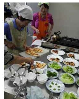
<New York Pizza↑>

この料理講座では、会員から募集したボランティアの方に、メニュー選びから、事前の試食作りや当日の運営等をお手伝いして頂いています。有難う御座いました。